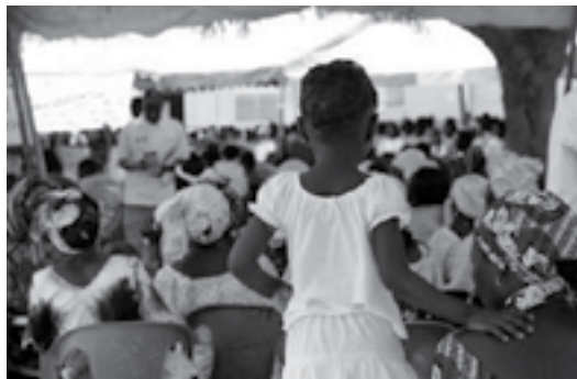
تجربه برتر در زمینه مشارکت جامعه محلی در مدیریت زیست شهر