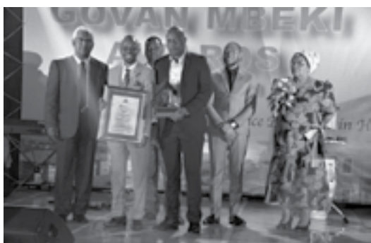
تقدیر از کنشگران اثرگذار در بهسازی سکونتگاه غیر رسمی در emapheleni