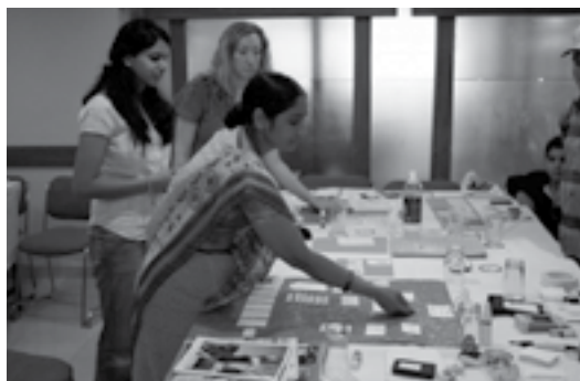
تجربه برتر در زمینه فقرزدایی از طریق مشارکت جامعه محلی در هندوستان

تصاویر حاضر، برخی از برندگان این جایزه در دوره‌های مختلف را نشان می‌دهند.