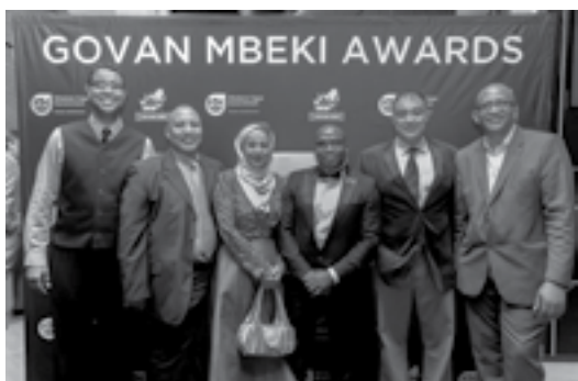
مراسم اعطای جوایز رویداد گوان امبکی