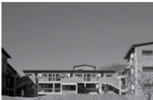
تجربه برتر جایزه گوان امبکی در زمینه مسکن اجتماعی

تصاویر حاضر، برخی از برندگان این جایزه در دوره‌های مختلف را نشان می‌دهند.