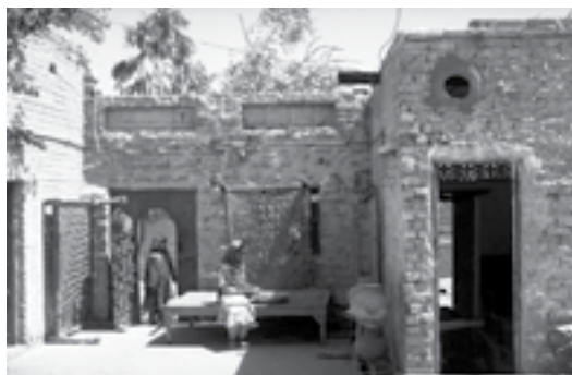
سکونتگاه خدا کی بستی - تجربه برتر در زمینه خانه سازی برای فقرا