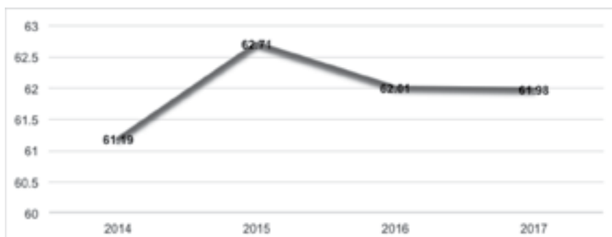
نمودار ۳. روند تغییر امتیازات ایران در شاخص پیشرفت اجتماعی، ۲۰۱۷-۲۰۱۴ میلادی

شاخص پیشرفت اجتماعی که مؤسسه غیرانتفاعی «پیشرفت اجتماعی الزامی» ۲ تهیه و تدوین می‌کند ابعاد متعدد عملکردهای اجتماعی و زیست‌محیطی کشورها را بررسی می‌کند و در تلاش است تا با تلفیق داده‌های مربوط به عملکردهای زیست‌محیطی و اجتماعی کشورهای مورد بررسی با شاخص‌های اقتصادی سنتی مانند تولید ناخالص داخلی ارزیابی جامعی از عملکرد ملی کشورها ارائه کند. شاخص پیشرفت اجتماعی شامل سه دسته اصلی از زیرشاخص‌ها می‌شود که عبارت‌اند از: - نیازهای اساسی بشر: تغذیه و مراقبت‌های بهداشتی اولیه، آب شرب بهداشتی، سرپناه و امنیت شخصی - میانی رفاه: دسترسی به دانش پایه، دسترسی به