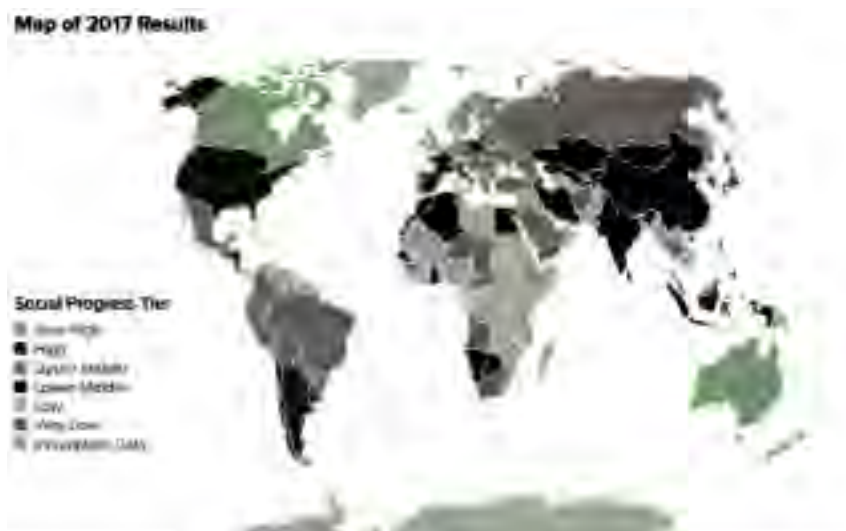
تصویر ۲. وضعیت کشورهای جهان در شاخص پیشرفت اجتماعی، ۲۰۱۷