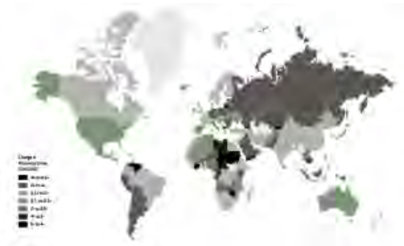
جدول ۳. وضعیت ایران و کشورهای منطقه در شاخص رفاه لگاتوم