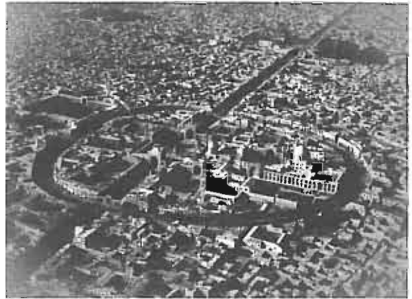
اطراف حرم مطهر - ۱۳۳۲

دومین حریم، حد فاصل بین دیوار حلقوی و خط محدوده بافت قدیمی شهر در نظر گرفته شده است که