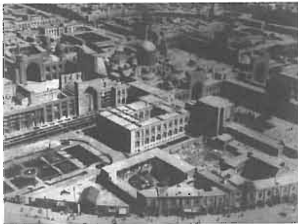
اطراف حرم مطهر حضرت رضا(ع) ۱۳۲۰ تا ۱۳۳۲

مرحله بعدی اقدامات در بافت مرکزی مشهد، تهیه طرح تفصیلی و تدوین ضوابط در چارچوب طرح جامع مصوب ۱۳۵۰ بود، که دفتر فنی همکاری مهندسين مشاور انجام آن را برعهده داشت. در این طرح، جز پیشنهاد احداث یک خیابان جدید ۳۵ متری، تغییر ساختاری عمده‌ای در بافت یاد شده پیش‌بینی نشد. گذرهای دسترسی عمدتاً مشمول لبه اصلاحی شدند. (۶) همچنین، براساس مقررات حفاظت حریم، بافت شهر قدیمی و بناهای تاریخی مربوط به طرح جامع مصوب، برای مجتمع حرم مطهر امام هشتم و ساختمان‌های مجاور در حریم تعیین شد. نخست، حریم داخل دیوار حلقوی دور مجموعه که حداکثر ارتفاع ساختمان‌ها در آن یک طبقه یا ۵ متر بود، و نباید هیچ‌گونه ساختمان یا مستعد ثانی نزدیکتر از ۲ متر به دیوارها و سطح نماسازی ساختمان‌های مجموعه حرم ساخته نشود.