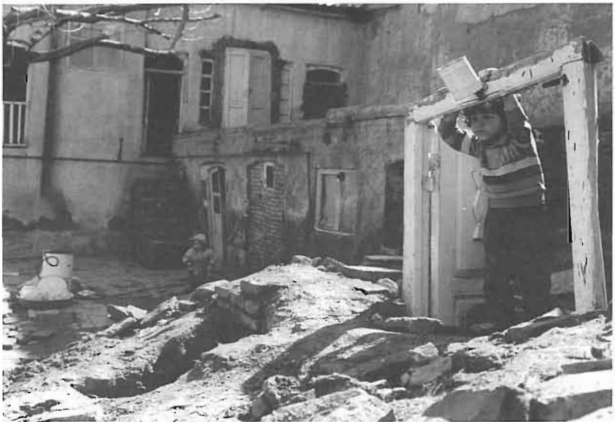
نابسامانی‌های حاصل از تخریب‌های عجلانه و از هم پاشیدگی ساختار بافت.

شاید بتوان گفت که تفکر حاکم در زمان تهیه طرح که از قوانین برنامه پنج ساله دوم و رویکرد نوسازی و تملک و تجمیع به منظور اقدامات دفعی ناشی شده بود، تجربه‌های مداخله در بافت شهری در این دوره را به سوی شهرسازی