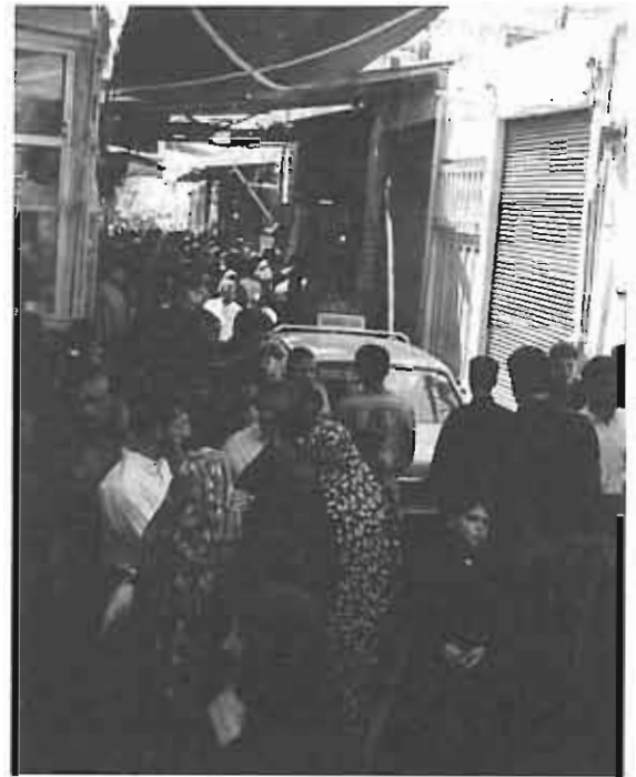
ازدهام جمعیت در بازارهای پیرامون حرم امام رضا(ع)

عرصه عمل آن را تشکیل می‌دهد. بنابراین، وجود ضعف و کاستی در هر یکی از این دو مورد، برآیند حاصل را برای تاثیرگذاری در بستر شهری موجود ناتوان می‌کند. لذا در مجموع شاید بتوان عمده‌ترین ضعف‌های دوره‌های مختلف را در دو دسته کلی زیر، رده‌بندی کرد: