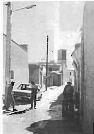
گذر محله تل