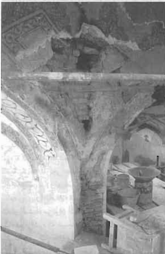
اصفهان، حمام شاه علی - رویه برداری تزئینات نقاشی، ادامه عملیات استحکام بخشی بدنه‌ها ۸۱-۱۳۸۰

دیدگاه گذشتگان سرزمین ما از زمان خود بسیار فراتر می‌رفته و آنها آینده را کاملاً می‌دیدند و بقای تمام این آثار تا به امروز، علیرغم آسیبهای ویرانگر طبیعی و انسانی، به یمن مراقبت مردم و مسئولان کشور در گذشته میسر شده است. نمونه‌های موجود مرمتی انجام شده در گذشته اگر شناسایی و معرفی شوند و تاریخ و مبانی آنها را تدوین کنیم، خود به صورت یک منشور ملی مرمت قابل استناد خواهد بود.