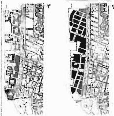
تصویر ۱: سزار پلی، مرکز تجارت جهانی، ۱۹۸۱. همراه با آسمانخراشها و توسعه جدید، بر تشکیل یک ترکیب همگن با شهر موجود تلاش می‌کند.