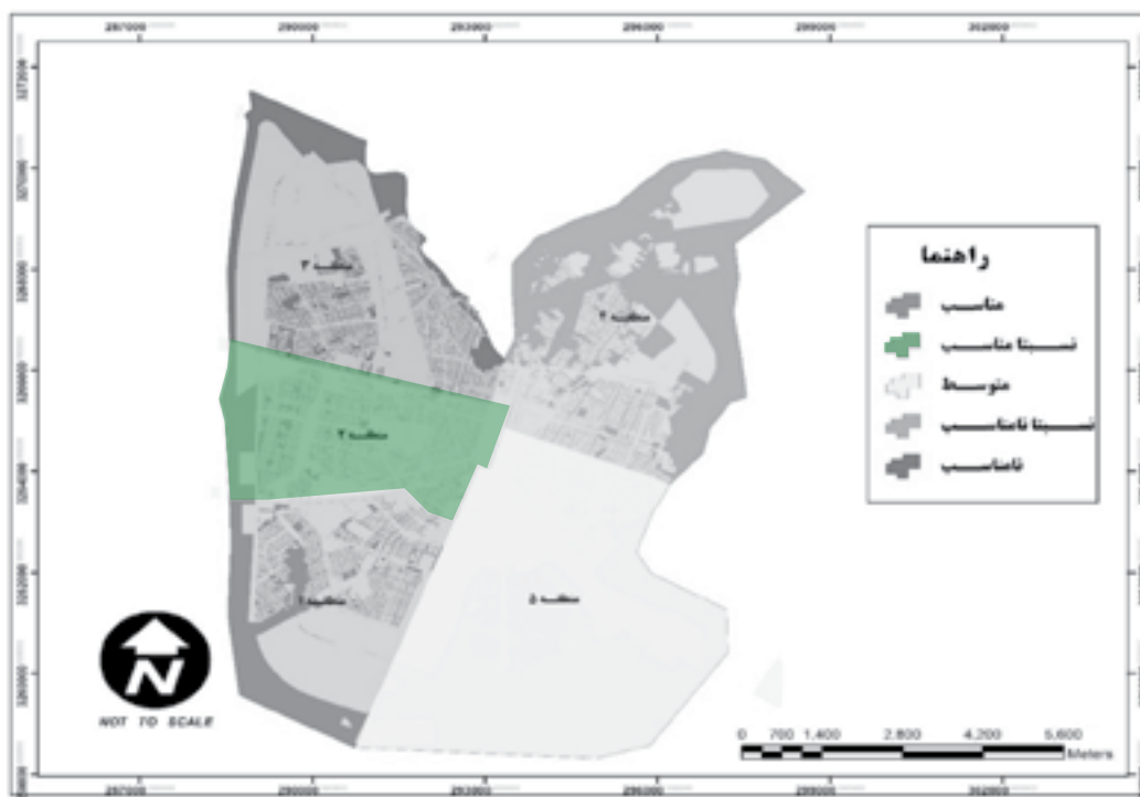
شکل ۲. رتبه‌بندی مناطق در شاخص‌های سرمایه اجتماعی و امنیت