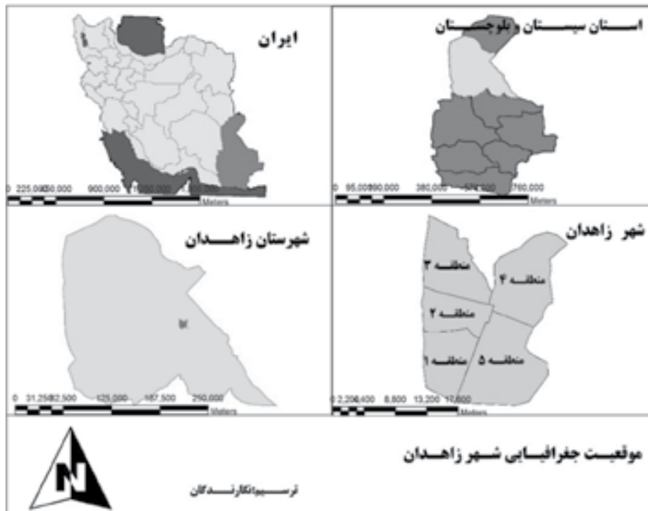
شکل ۱. موقعیت جغرافیایی محدوده مورد مطالعه

زاهدان شهری مرزی در جنوب شرق ایران است که اکثر شهروندان آن، به‌ویژه عوام و بازاریان، بنا به دلایلی همچون هم‌زبانی و هم‌مذهبی و همچنین ارتباط اقتصادی قوی با کشور پاکستان و افغانستان، بیشتر متأثر از فرهنگ همسایگان شرقی هستند؛ فرهنگی که در آن زنان با محدودیت‌ها و مشکلات خاصی همچون ازدواج در سن پایین، انتخاب همسر از سوی اعضای خانواده، تعدد زوجین برای مردان، میزان تحصیلات پایین جنس مؤنث، ازدواج به شیوه کاملاً سنتی، و بسیاری از مشکلات دیگر روبه‌رو هستند. در این فرهنگ و محیط بسته، حضور زنان در فضاهای شهری هنوز کاملاً عادی محسوب