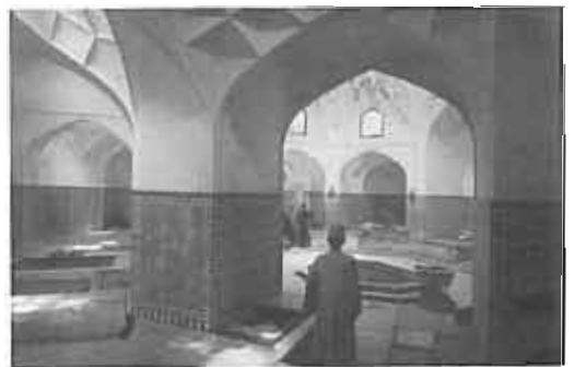
حمام گنجعلی خان - کرمان