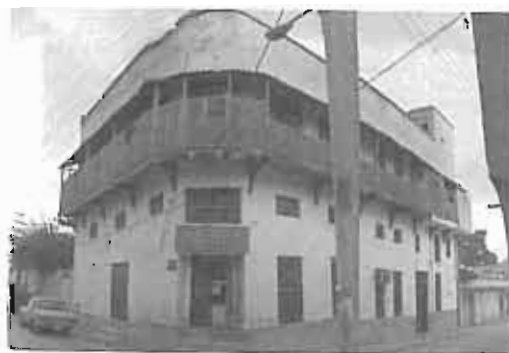
خانه نوذری - بوته‌ساز، کاربری جدید، دفتر بیساز بافت قدیم