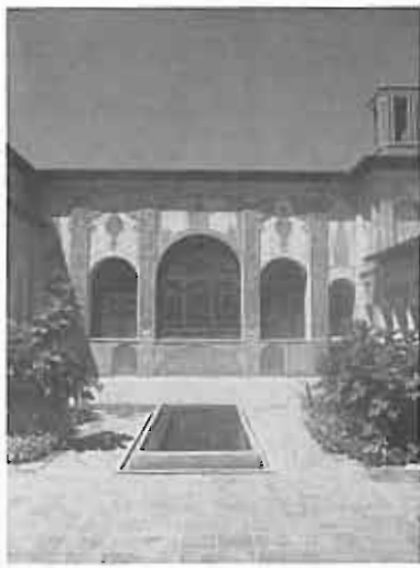
خانه طباطبایی ها - کاشان