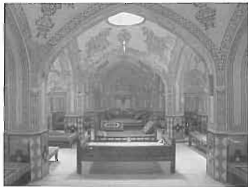
حمام میر احمد - کاشان