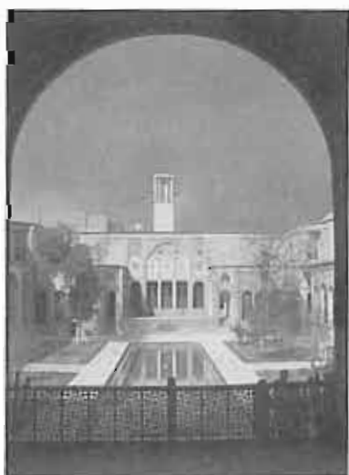
خانه بروجردی‌ها کاشان