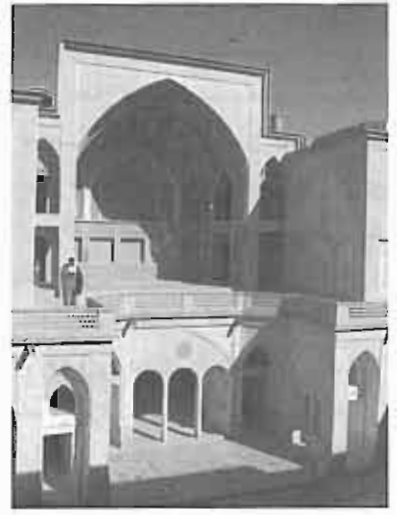
خانه عباسیان - کاشان