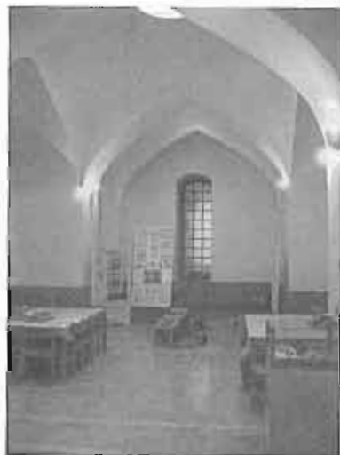
حمام وزیر اصفهان - کاربری جدید، کانون پروژه فکری کرده‌گان و نوجوانان

علی‌رغم تأثیر متأخر، از اندیشه‌ها و تجارب اروپا در