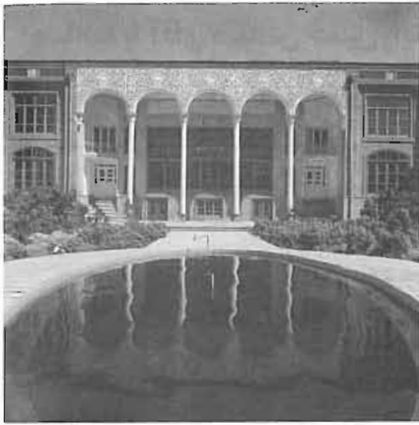
خانه قدکی - تبریز