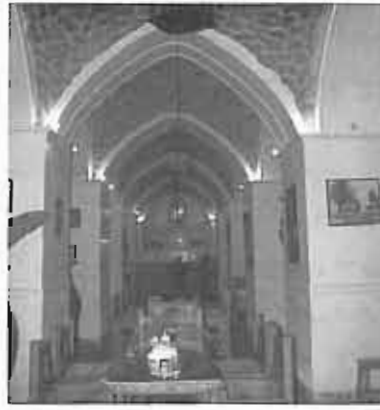
آب انبار قوام - بوشهر