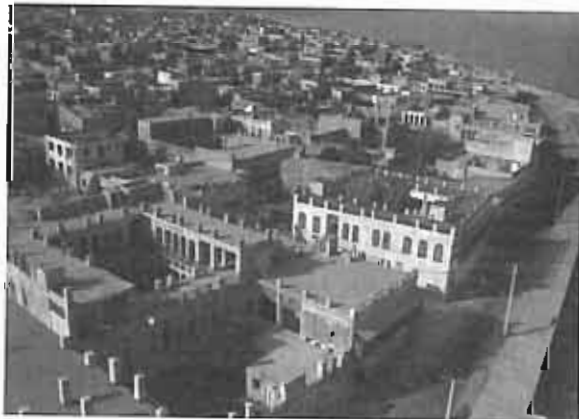
خانه طبیب - برشیر، کاربری جدید، سازمان ایرانشناسی