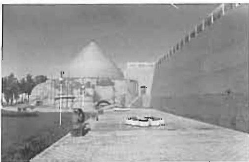
یخچال معیر - کرمان