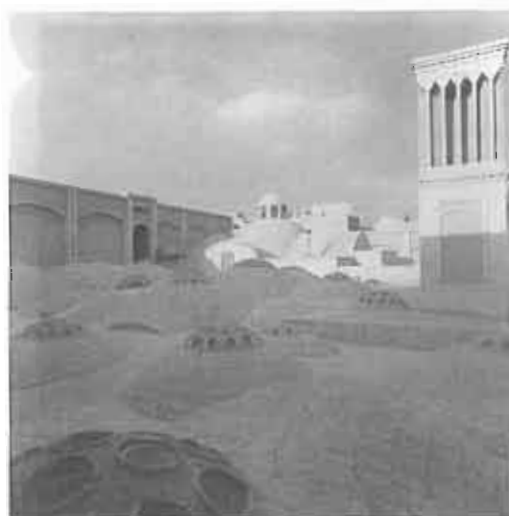
حمام خان بزد - کاربری جدید، رستوران سنتی