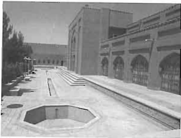
قلعه گرگد - گلپایگان، کاربری جدید پذیرایی - جهانگردی