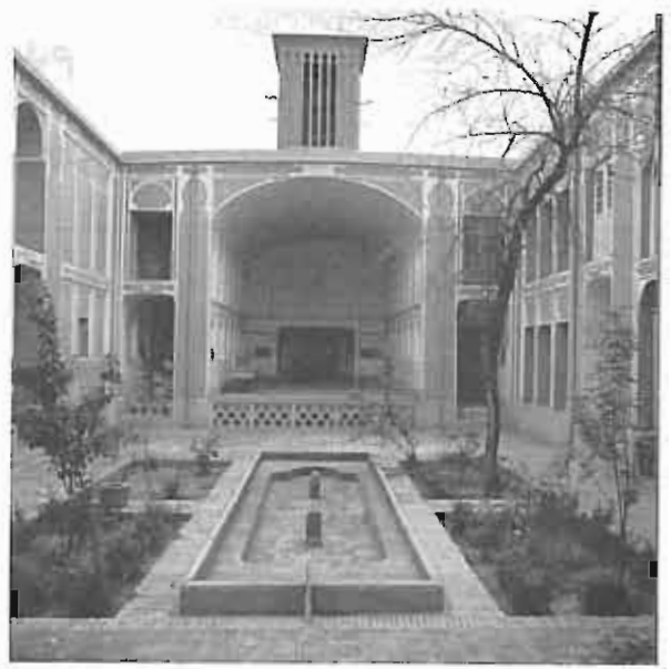
خانه مزید - یزد، کاربری جدید، سازمان ایرانشناسی